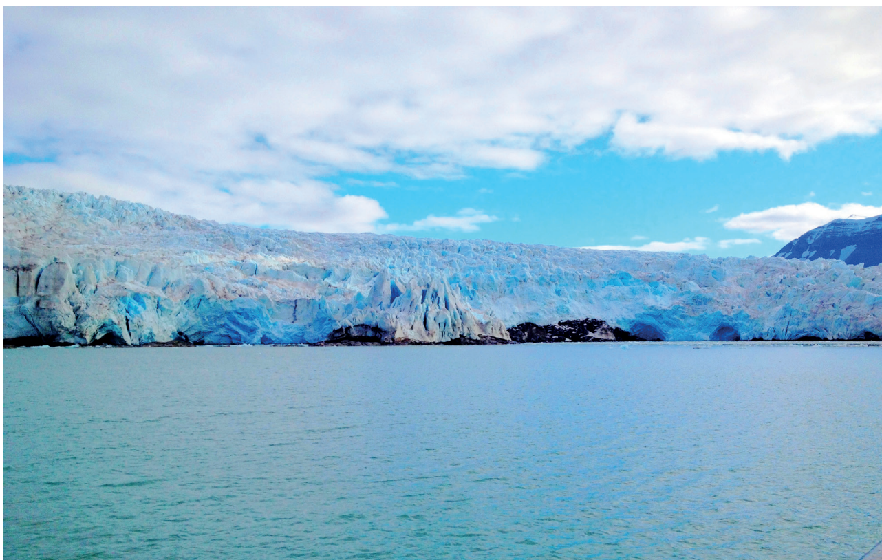
Nordenskiöld-breen på Svalbard, foto: Carl-Erik Christoffersen

blir solgt. Med det tenker jeg ikke på en umiddelbar nedleggelse av oljebransjen, men heller å unngå å bygge ut nye oljefelt. Felt som skal pumpe ut ny olje langt inn i framtiden. Olje som vi heller ikke vet om vi får solgt i framtiden. Dette er dårlig miljøpolitikk og trolig også dårlig økonomisk politikk. Nasjonalt er også transportsektoren noe vi selv kan gjøre noe med. Deretter har vi utslipp fra industri, bygg og landbruk som må ned.