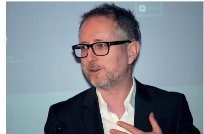
Påtroppende WWF-sjef Bård Vegar Solhjell

- Dette er ikke et enten eller, mener tidligere miljøvernminister Bård Vegar Solhjell. Vi kan ikke redde klimaet med noen få store tiltak. Vi kan heller ikke nå målet om bare alle slukker lyset og kildesorterer, understreker han.