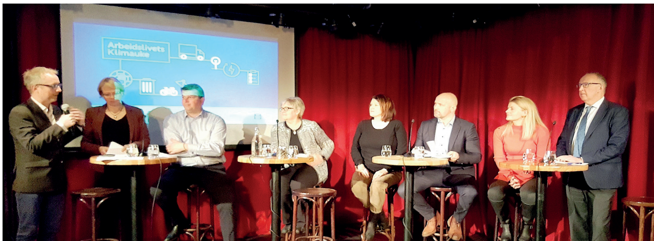
Alle de største hovedorganisasjonene var til stede da startskuddet gikk for Arbeidslivets klimauke.

Da tidligere klima- og miljøminister Vidar Helgesen åpnet Arbeidslivets klimauke nylig, hentet han fram eksemplet om at kantinesjefen i hans eget departement nå kaster mindre av den maten som kom fra kantina. Et praktisk, konkret og forståelig eksempel på en grønnere profil. Er det slike tiltak som skal til for at Norge når de forpliktelser vi har påtatt oss i Parisavtalen?