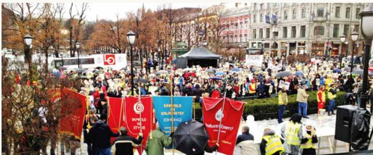
Fra den politiske markeringen foran Stortinget 28. januar 2015.

førte til et svært dårlig klima mellom dem og arbeidstakerne, som igjen førte til en mobilisering av halvannen million arbeidstakere i en politisk markering.