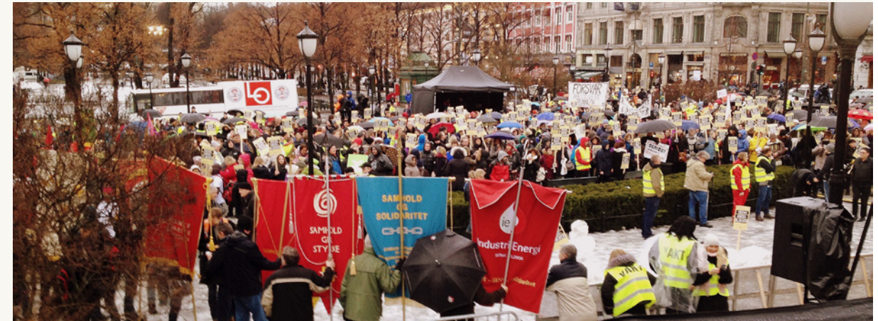
Daværende arbeidsminister klarte å skape den største arbeidstakermarkeringen på 17 år. Spørsmålet er om vi får se flere av disse.

påvirke trepartssamarbeidet og hovedorganisasjonenes status og posisjon over tid, og vil det – satt på spissen – være noen fagbevegelse å lede i framtiden? - Det er ikke tvil om at færre organiserte gir arbeidstakerne mindre innflytelse i trepartssamarbeidet. Det har derfor vært viktig for oss hele veien å få flere til å organisere seg. Vi ser at unge på vei inn i arbeidslivet kan bli fristet av individuelle løsninger. Det er de kollektive løsningene som varer over tid.